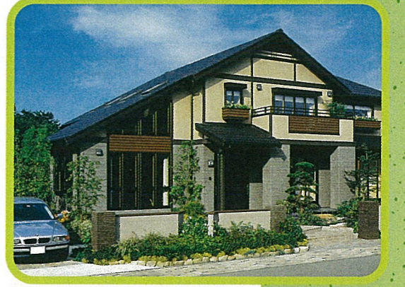
セキスイツーユーホーム