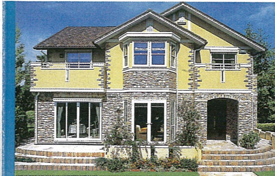
ツーユーミオーレ