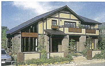
ツーユーセントウ